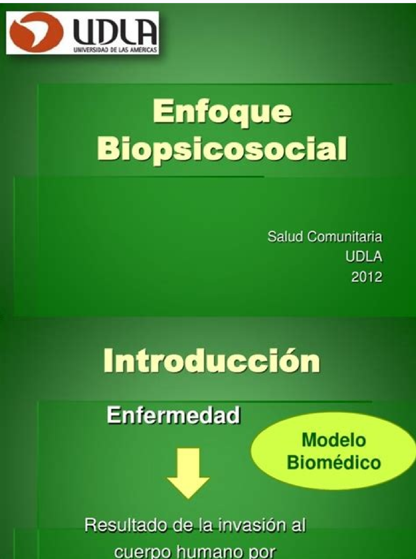
El hombre como unidad biopsicosocial.